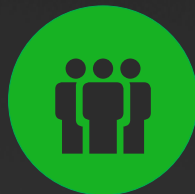
千人城市服务团队